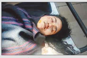
अस्पताल में भर्ती युवती।