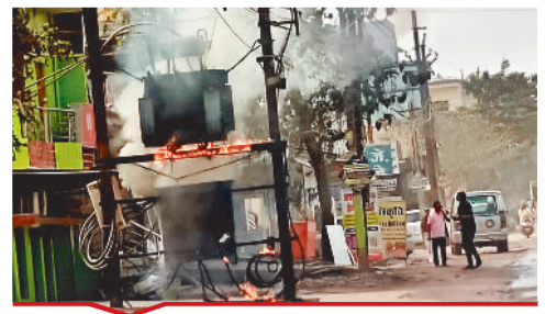
तोरावा छतदार रोड पुल के पास ट्रांसफार्मर में लगी आग।

[ बिल्हा | मस्टूरी | तखतपुर | मुंगेली | कोटा | लोरमी | सरगांव | पेंड़ा | बेलतरा | रतनपुर | पथरिया ]