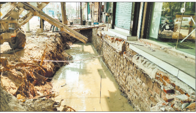
मंगला चौक की नालियों पर बनीं दुकानें।