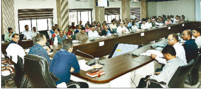
प्राचार्यों की बैठक लेते कलेक्टर।

इसके अलावा शिक्षा गुणवत्ता में बेहतर सुधार नहीं लाने पर लालपुर, मनोहरपुर, लगरा, देवरहट, डोंगरिया, राम्हेपुर, बैनाकापा एवं गोड़खाम्ही स्कूल के प्राचार्यों की वेतन वृद्धि असंचयी प्रभाव से रोकने के निर्देश दिए। मुख्यमंत्री शिक्षा गुणवत्ता अभियान अंतर्गत जिले में 'मिशन 90 प्लस' परीक्षा परिणाम उन्नयन कार्यक्रम' प्रारंभ किया गया है। इस पहल का उद्देश्य शासकीय हाई एवं हायर सेकेंडरी स्कूलों में अध्ययनरत कक्षा 10वीं एवं 12वीं के विद्यार्थियों को