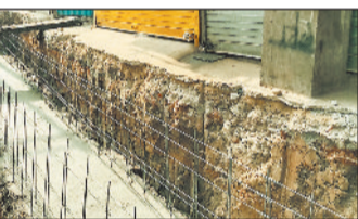
मंगला रोड में पेट्रोल पंप से लेकर आगे तिवाड़ी कॉम्प्लेक्स तक डेढ़ किलोमीटर के हिस्से में करीब 46 लोगों ने अपने घर और दुकानों के सामने 10 से 20 फीट तक का पक्का निर्माण कर अतिक्रमण किया हुआ था।

मंगला रोड में पेट्रोल पंप से लेकर आगे तिवाड़ी कॉम्प्लेक्स तक डेढ़ किलोमीटर के हिस्से में करीब 46 लोगों ने अपने घर और दुकानों के सामने 10 से 20 फीट तक का पक्का निर्माण कर अतिक्रमण किया हुआ था। सड़क चौड़ीकरण के लिए इन अतिक्रमण को हटाना आवश्यक था। निगम कमिश्नर ने सड़क निर्माण एवं चौड़ीकरण के लिए कार्य योजना तैयार करने के और अतिक्रमण हटाने के निर्देश दिए थे। नगर निगम द्वारा सभी अतिक्रमणकारियों को कब्जा हटाने नोटिस जारी किया गया था। निर्धारित समय सीमा में अतिक्रमण नहीं हटाने पर आज नगर निगम द्वारा बड़े पैमाने पर ढल बल के साथ सभी अतिक्रमण को हटाया गया। पूरे दिन भर चले कार्रवाई में सड़क चौड़ीकरण के लिए रास्ता अब साफ हो गया।